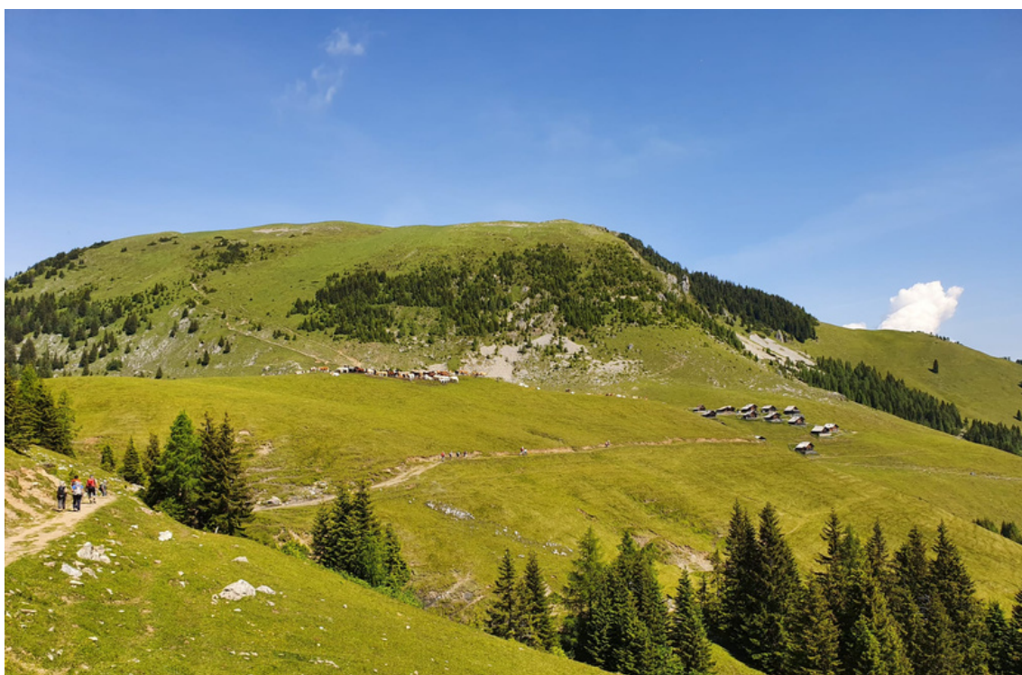
Pascoli e villaggio Feistrizer Alm

Il villaggio austriaco, Feistrizer Alm, è abitato nella stagione estiva e i pascoli sono sfruttati nell'alpeggio infatti su diversi tronchi sono inchiodati cartelli bilingue che invitano i turisti a non disturbare gli animali liberi al pascolo.