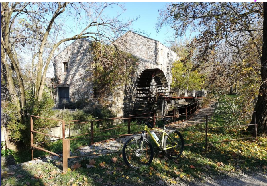
Mulino Tra Zuliano e Pozzuolo del Friuli (Foto: Nicola Michelini).

Società Alpina Friulana Sezione di Udine del CAI OdV Via Brigata Re, 29 – Udine Segreteria – tel. (+39) 0432 504290 mail: escursionismo@alpinafriulana.it website: www.alpinafriulana.it